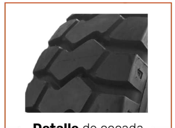
Detalle de cocada