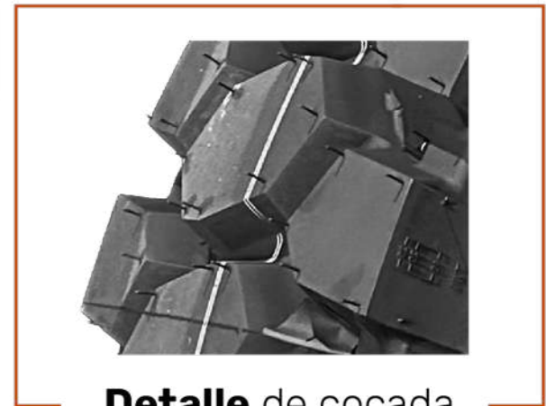
Detalle de cocada