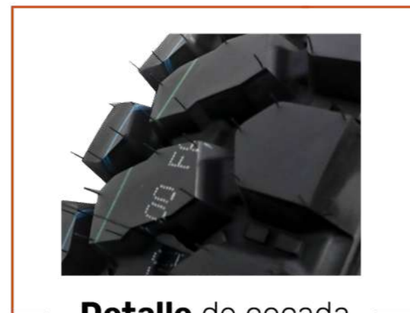
Detalle de cocada