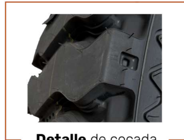
Detalle de cocada